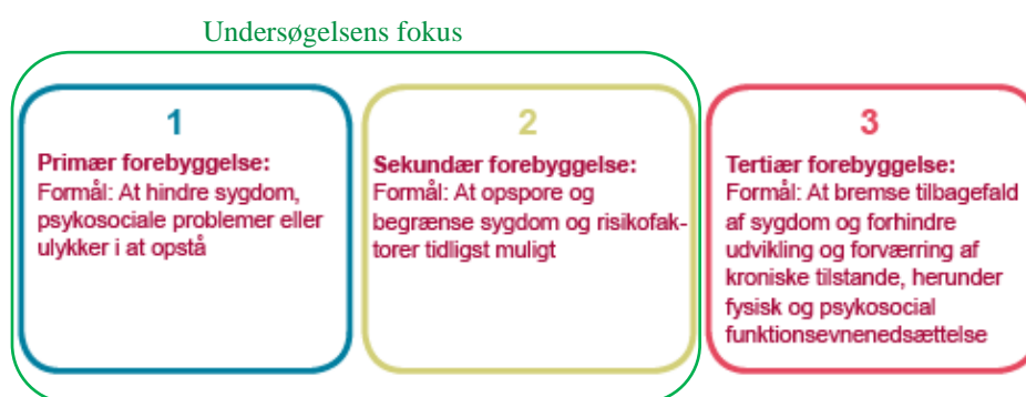
Figur 1.1: Forebyggelse